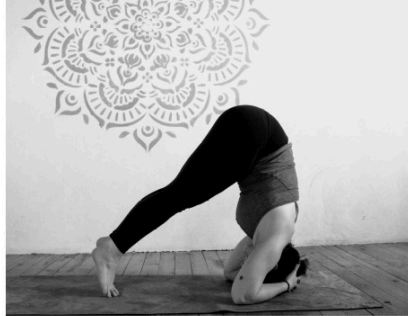
Vic Vinyasa Yoga : la reprise !

Avec une nouveauté : les cours de yoga sur chaise en association avec l'ADPAM Gers !