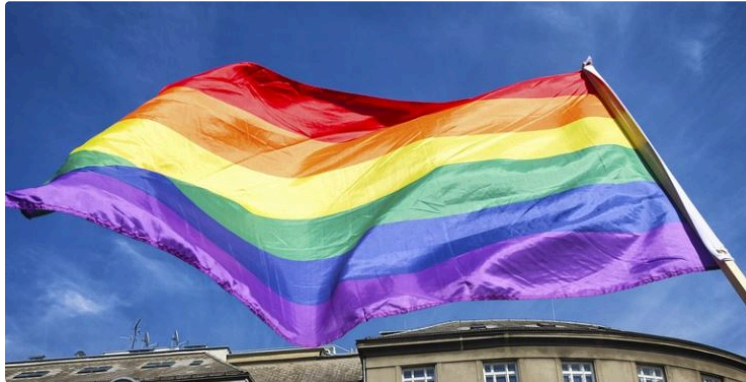
Première Marche des Fiertés dans l'histoire du Gers

L'association départementale du Planning Familial du Gers annonce la tenue de la première Marche des Fiertés de l'histoire de notre département.