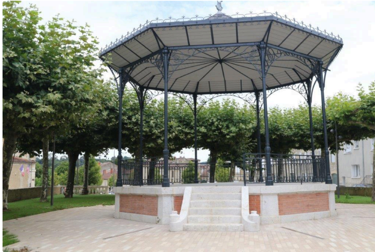
Dépayement et exotisme pour l'inauguration du Kiosque

Découvrez en musique le Rio Paraná, un fleuve impétueux