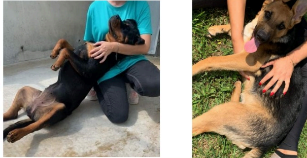
Le 26 août, une journée pour nos amis les chiens !

Après le 8 août, journée internationale du chat, la SPA du Gers attire notre attention sur la date du 26 août qui est la journée mondiale du chien, le meilleur ami de l'homme.