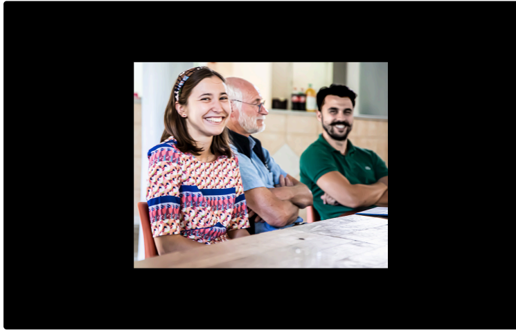
InSite va aux résultats de ses jeunes du Service civique à Perchède

Employeurs, employés, autorités: tous satisfaits