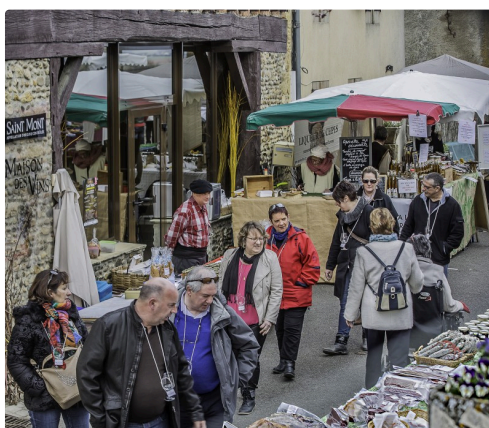
1 Les visiteurs déambulent à Saint-Mont 1bis 190316.jpg