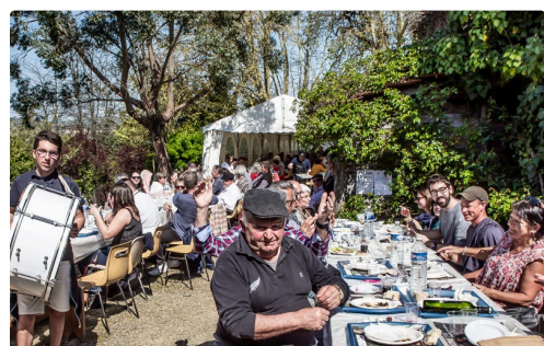
12 Autre coin de repas aux tisons en musique 1bis 300319.jpg