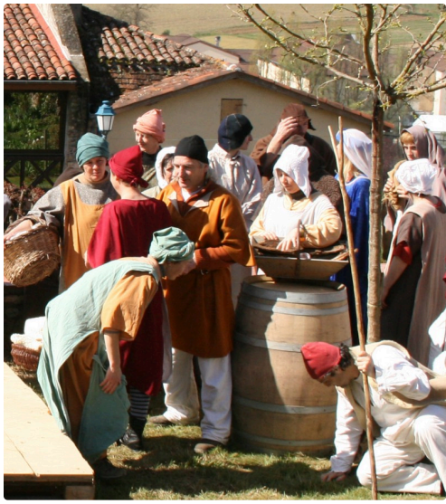
Habits moyenâgeux 2 290308.jpg