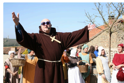
JP Coffe à Saint-Mont 3 290308.jpg