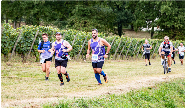
Programme «Saint Mont territoire en fête» du 3 au 5 septembre 2021

Traditionnellement, la manifestation Saint Mont vignoble en fête a lieu au dernier week-end de mars. Vu la crise sanitaire, elle a lieu en même temps que Saint Mont vignoble en course, les vendredi 3, samedi 4 et dimanche 5 septembre, sous la dénomination commune de Saint Mont territoire en fête.