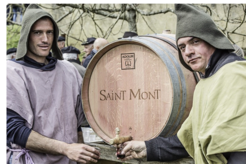
16 Ca coule 2bis 190316.jpg