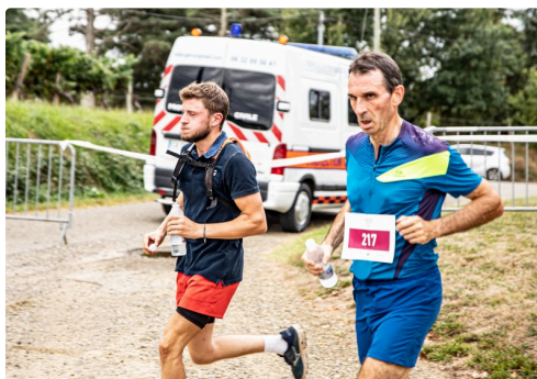
10 Passage de coureurs de la 20 km à Saint-Gô 1bis 190920.jpg