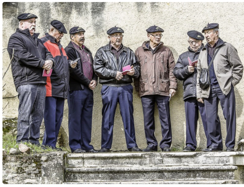
Les Chanteurs vigneron du Vic-Bilh