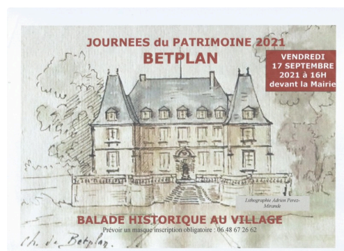
Betplan Journée du Patrimoine 2021.

Pour ceux qui ne le possède pas encore, les conférencières dédicaceront leur livre « Betplan 1419-2019 », Cet ouvrage retrace le résultat de leurs recherches dans près de 200 pages, dans une rédaction claire agrémentée de plans et photos. Cette monographie est un ouvrage qui devrait trouver sa place dans de nombreuses bibliothèques et satisfaire la curiosité des amateurs d'Histoire régionale.