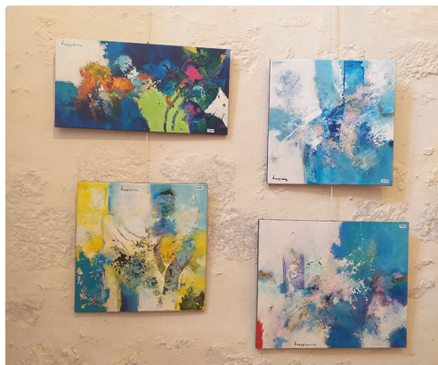
expo lecture 3.jpg