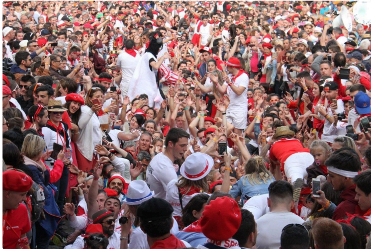
Enfin, les retrouvailles !

Pas vraiment les Bandas, mais de quoi fanfaronner un petit week-end