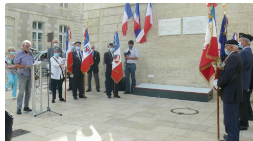
Les porte-drapeau devant la stèle de la Résistance.