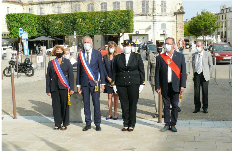
77ème anniversaire de la libération de la ville

La commémoration du 77ème anniversaire de la libération de la ville d'Auch a été célébrée ce jeudi 19 août, à 18 heures. La cérémonie a débuté place de la Libération au pied des allées d'Étigny, en présence des autorités civiles et militaires, de six porte-drapeaux et des familles.