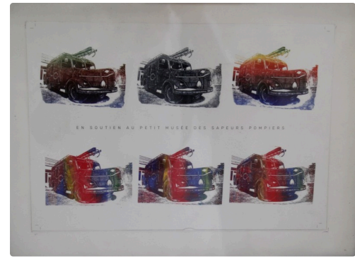
Petit musée des sapeurs-pompiers de Miélan.