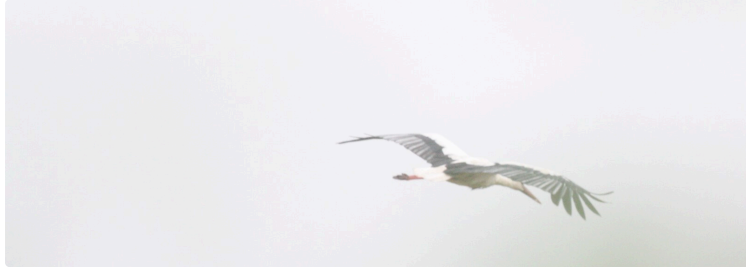
Quand Bezolles séduit Dame cigogne...