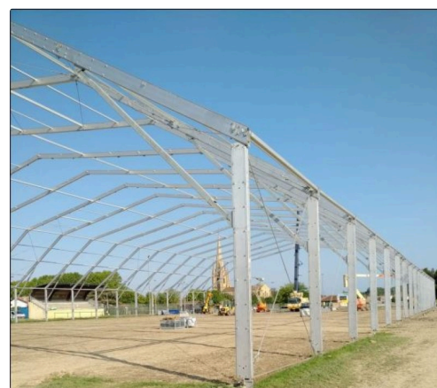
la pelouse libérée en 48 heures.JPG