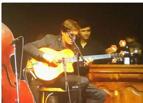
jacques Dutronc en toute simplicité.JPG