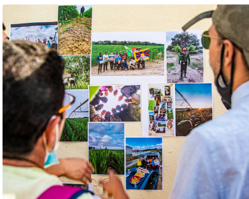
9 Devant les photos 1bis 050821.jpg