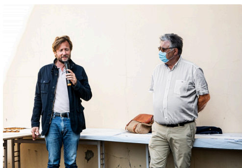
8 Intervention de Boris Vallaud 1bis 050821.jpg