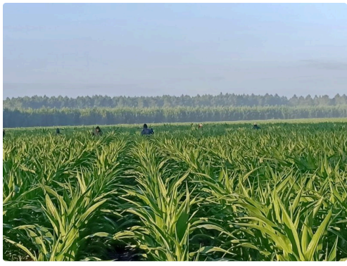
DR5 4 SaisonsWhatsApp Image 2021-06-25 at 09.32.04 (2).jpeg