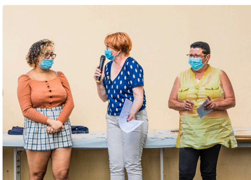
6 Etudiante et son contremaître interrogés par Sylvie Robin 1bis 050821.jpg