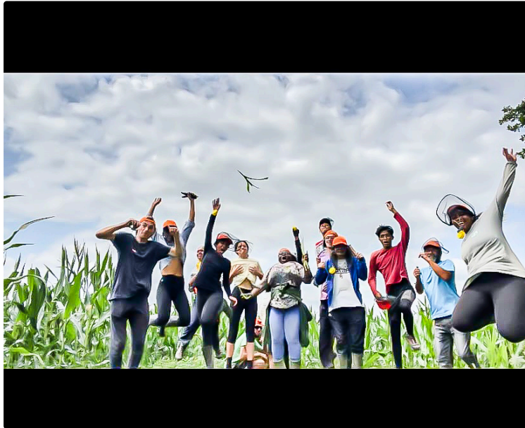
Des jobs solidaires aux étudiants fauchés (en Occitanie et Nouvelle Aquitaine)

Pimao a eu l'idée, 4 Saisons avait les jobs, et la MFR d'Aire-sur-l'Adour, l'hébergement