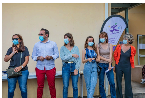
5 Equipe des organisateurs de 4 Saisons 1bis 050821.jpg