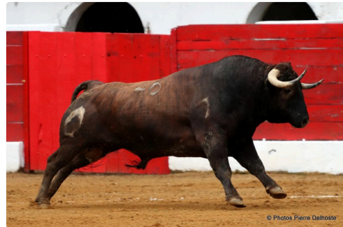
Toro n°3 à Riscle 31 juillet 2021

Il a coupé une oreille à chaque novillo et a été déclaré vainqueur de cette première édition de la coupe de France des novilleros, une compétition illuminée par les Camino de Santiago dont Jean-Louis Darré peut être fier.