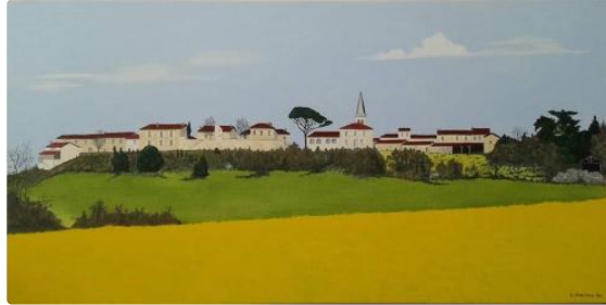
Le bonheur est dans le Gers... et l'art est à Roques !

Beaucoup de visiteurs à Roques pour le vernissage de la deuxième édition d'Art à Roques, cette exposition atypique qui permet de découvrir des artistes en même temps que le village.