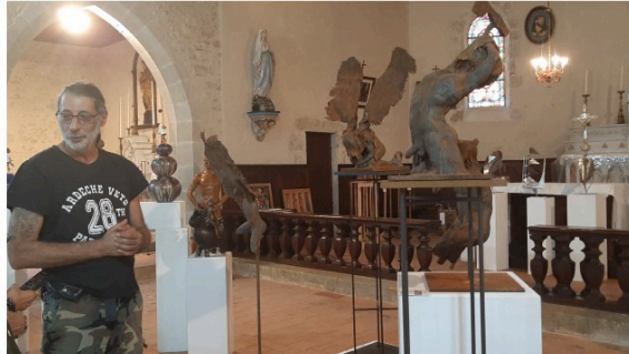
"Le fils de l'homme" de Pascal Borghi vous accueille à Mourède !

Elle vous accueille à votre arrivée sur la place de l'église de Mourède et vous interpelle.