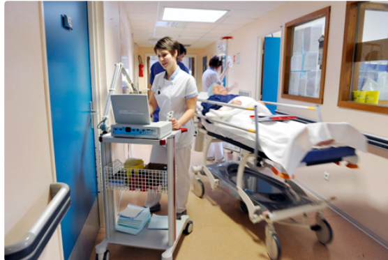
L'Occitanie déclenche le plan blanc dans ses hôpitaux

La dégradation brutale et rapide des indicateurs dans notre région confirme le fort impact de la quatrième vague épidémique selon santé publique.