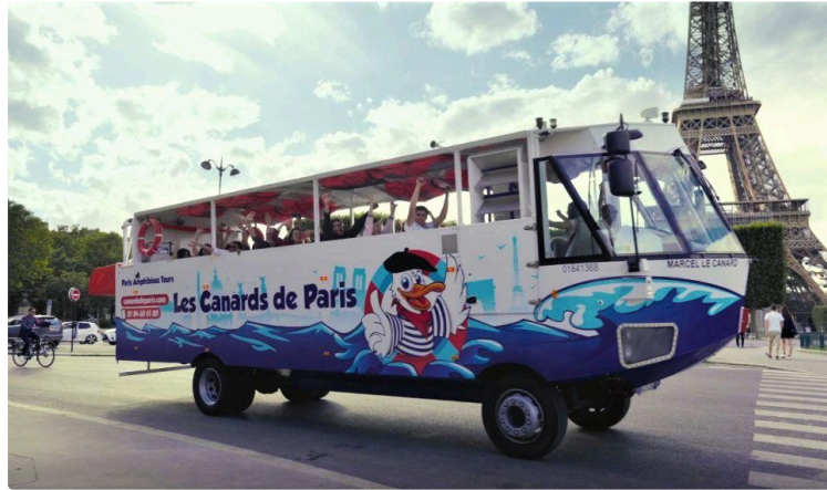
Le premier bus amphibie français a des gènes gersois

Marcel le Canard vous fait visiter Paris, avant de plonger dans la Seine !