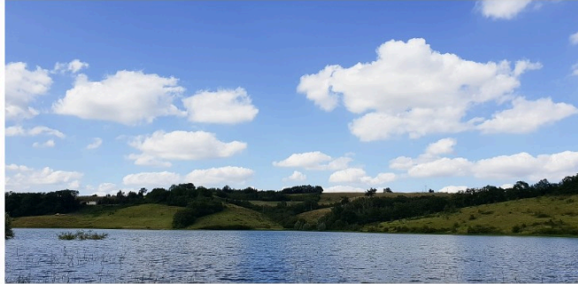
Partez à la découverte de la biodiversité du lac de Saint-Jean à Peyrusse-Vieille

Dans le cadre des animations de l'été, l'Office de Tourisme d'Artagnan en Fezensac en partenariat avec la mairie de Peyrusse-Vieille et le CPIE organise vendredi 6 août à 10 h une balade à la découverte de la biodiversité.