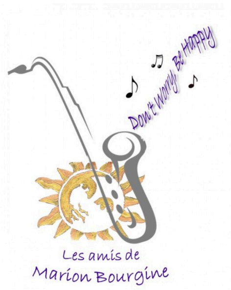
marciac marion affiche.JPG