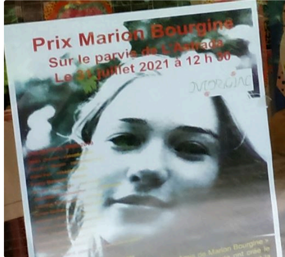
Prix Marion Bourguine