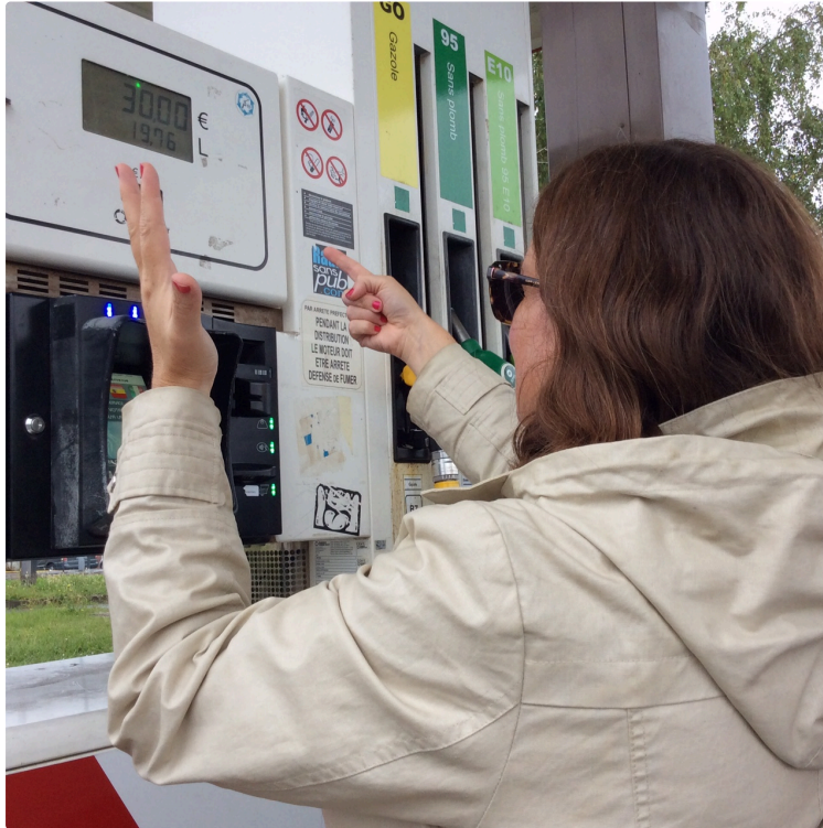
Le prix de l'essence a augmenté de 28 centimes en à peine 13 mois

Mauvaise nouvelle pour les vacances. Les Français désireux de changer d'air vont devoir mettre la main au portefeuille.