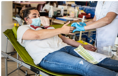
6 Donneuse 1bis 290721.jpg