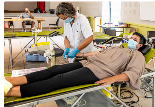
7 Donneuse 1bis 290721.jpg