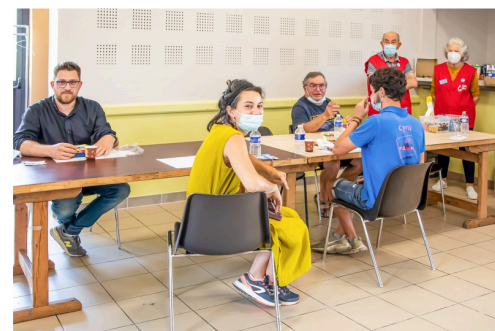
La collation après le don