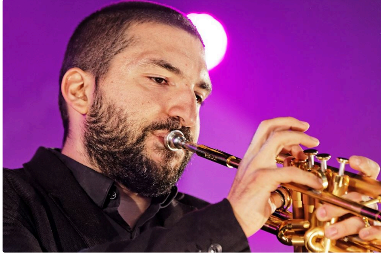
Une soirée prometteuse