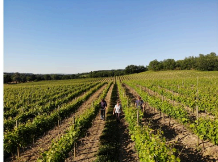
Le Domaine du Broca en fête le week-end prochain dans le cadre de Vineart

Nous avons rencontré Louis Della-Vedove du Domaine Le Broca à Roquebrune au sujet des balades-découvertes qu'il organise pendant l'été - les prochaines ont lieu mardi 10 et mardi 24 août à 18 h - : https://lejournaldugers.fr/article/49764-avec-lete-le-domaine-le-broca-ouvre-ses-portes