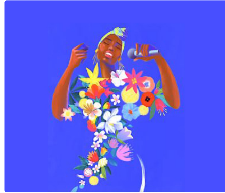
Et si, pour les Gersois, c'était la bonne année pour découvrir le festival JIM