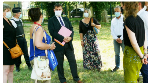
Le préfet du Gers, des représentants de l'Agglomération du Grand Auch et les équipes de CIRC et de Ciné 32 ont rendu visite aux divers ateliers.

D'autres rendez-vous sont programmés dont celui du 6 août avec un atelier Djembé et un concert.