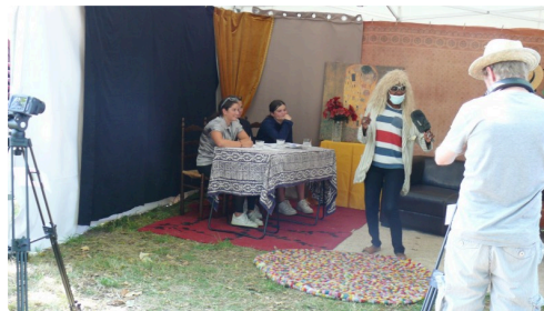
Scène du film dans un studio reconstitué.