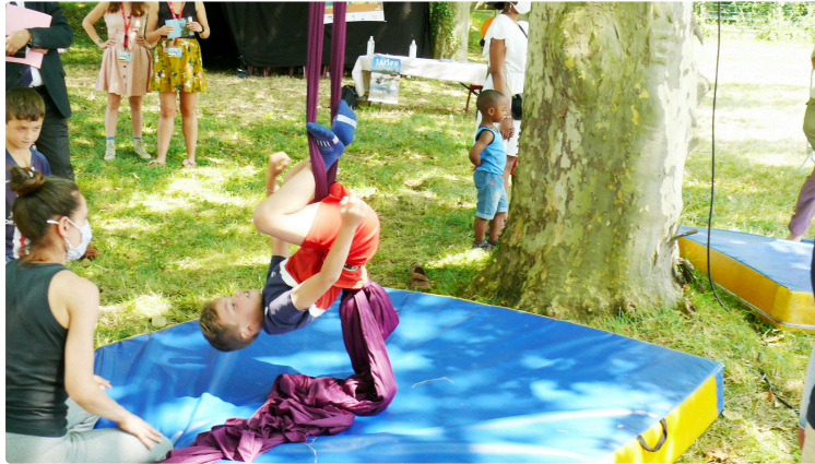
La Boubée au Garros sait se rendre attractif

Il ne manquait plus que le chant des cigales au parc de la Boubée au Garros ce mercredi 21 juillet après-midi pour mieux apprécier l'ombre bienfaisante des dizaines de platanes. Un endroit qui proposait à de nombreux enfants dans le cadre du dispositif Plan Quartier d'été, des ateliers de cirque, marionnettes, théâtre d'ombre et Cinéma initiés par CIRC et Ciné 32.