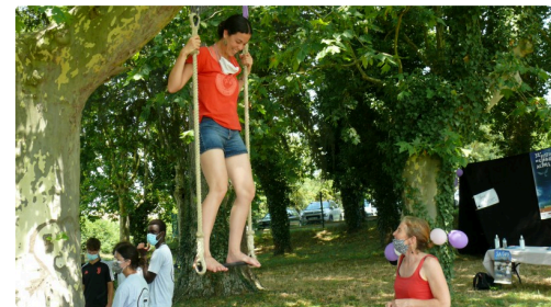
Tenir debout, le plus dur est fait...