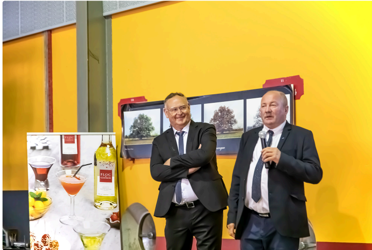
Le 14 juillet, Fête à la Cave des Hauts de Montrouge à Nogaro

Pour le partenariat avec Grands chais de France