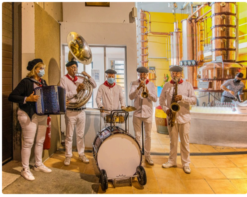
La musique était de la fête