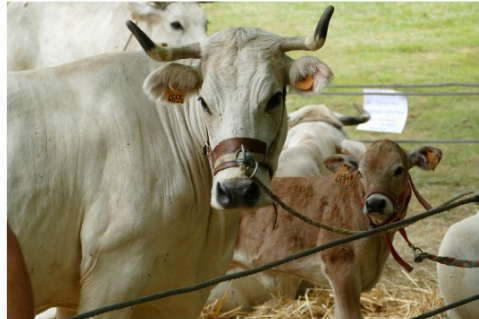
Retour ce dimanche de la Foire historique de la Madeleine à Montesquiou !

Une foire en l'honneur de la race Mirandaise