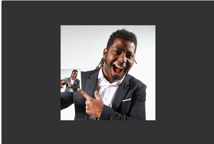
Jazz au cœur des vignes au château de Sabazan

Après une année blanche, la fête reprend en Gascogne et, en particulier au Festival Jazz in Marciac, du 24 juillet au 4 août 2021. Ce Festival est devenu si renommé que les plus grands artistes mondiaux y viennent avec plaisir. Les vigneron de Plaimont Producteurs, acteurs incontournables de la vie du Gers, parrainent chaque année des soirées de prestige du Festival. Cette année, ce sont :