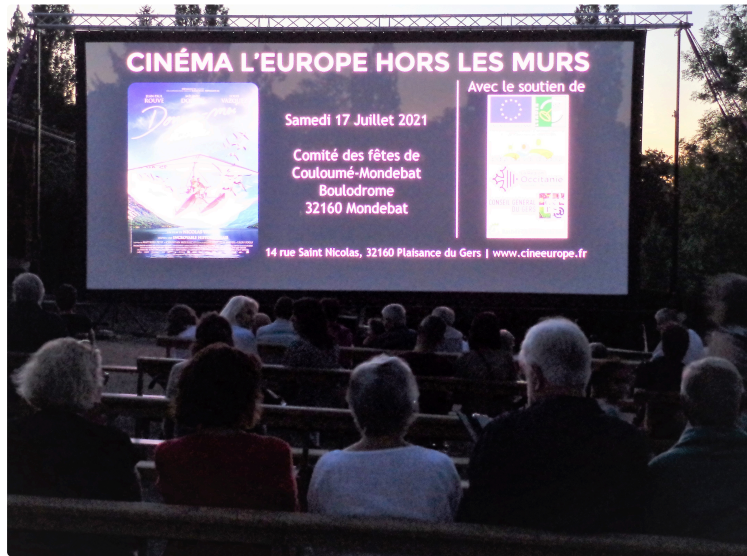
le ciné est dans le pré et le bonheur aussi

Ciné L'Europe se délocalise sur les collines de Couloumé- Mondébat-Bières