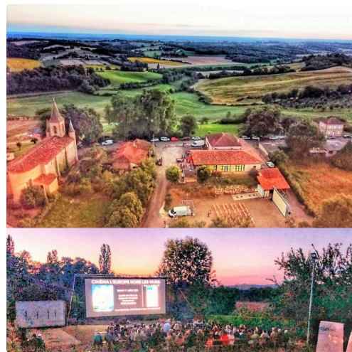
Photos de cinéma en plein air a Couloumé-Mondébat-Bieres ou ailleurs..

C'est donc bien "le cinéma pour tous" avec ces fameuses et réussies séances « hors les murs ».