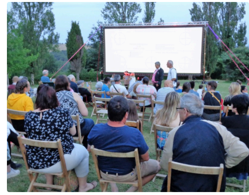
Un public heureux (2).JPG