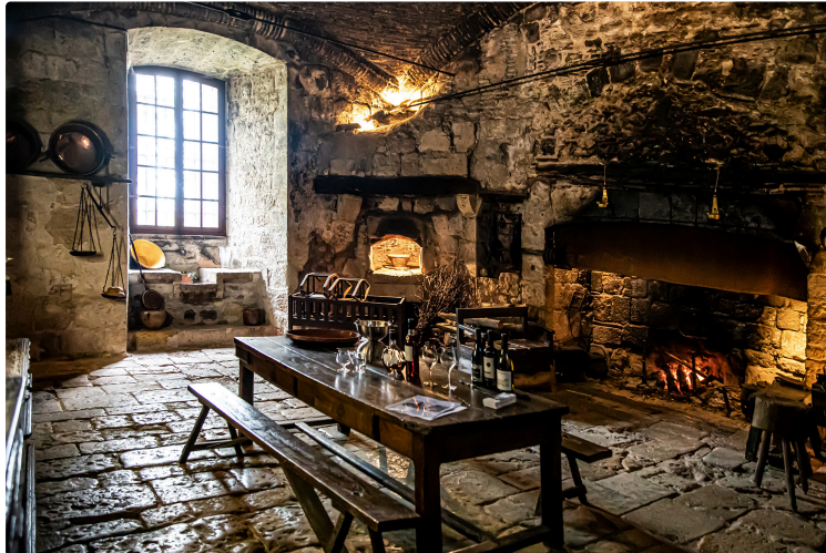
Vine Art : dégustations et rencontres artistiques chez les vignerons

L'été dans le vignoble des Côtes de Gascogne