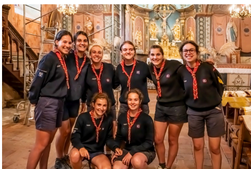
Les guides aînées, toujours souriantes !