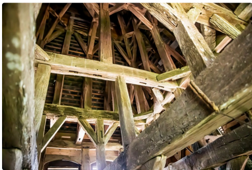
Charpente du sommet du clocher