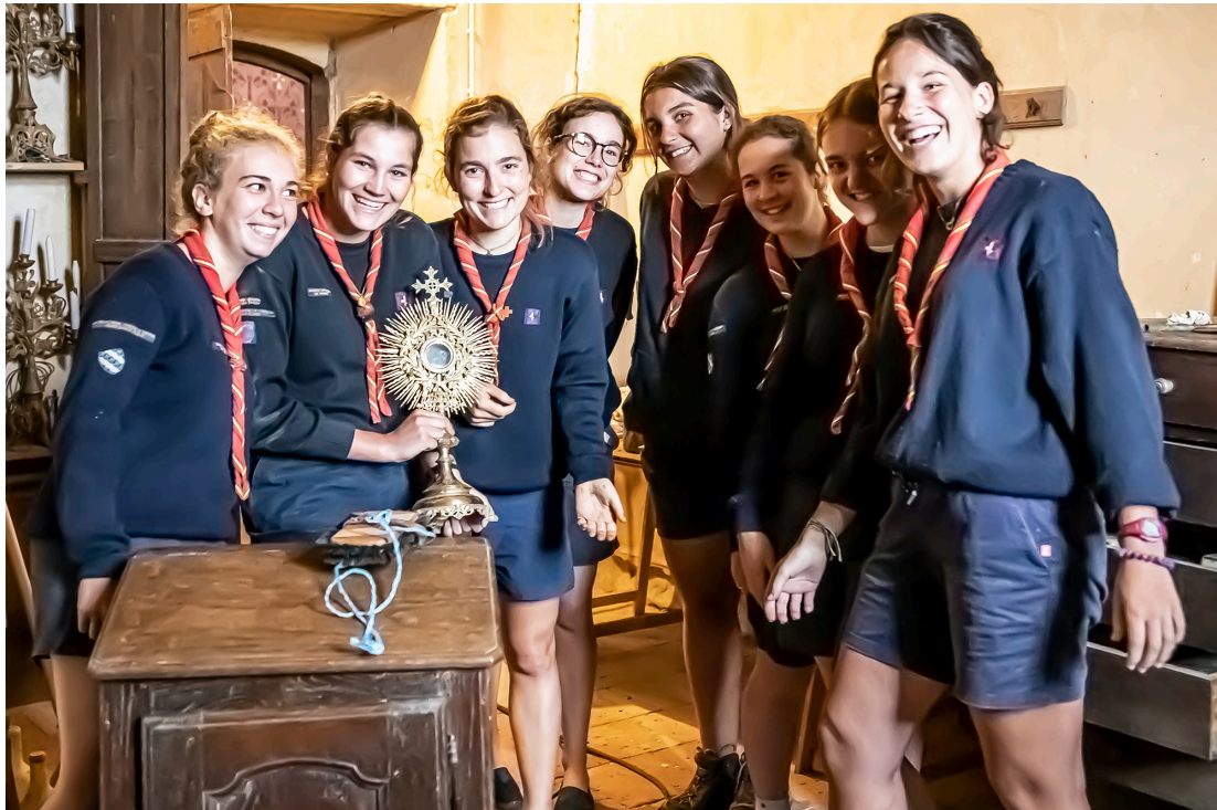
toute une série de chandeliers et de candélabres.