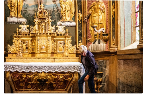
Le maître- autel dont les guides aînées ont lavé la nappe