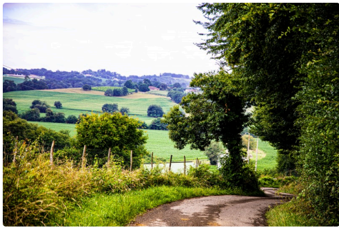
La campagne autour de Pouydraguin