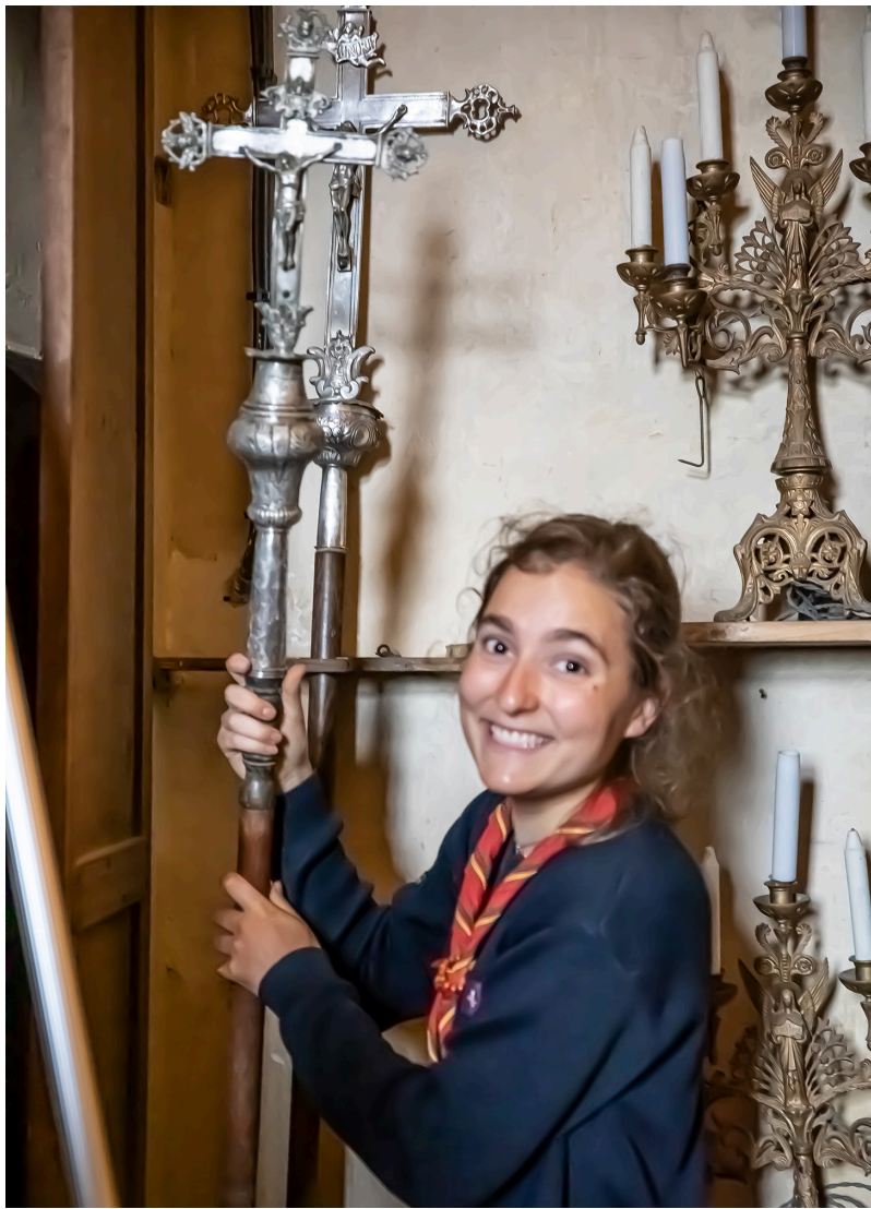
un bel ostensorio,