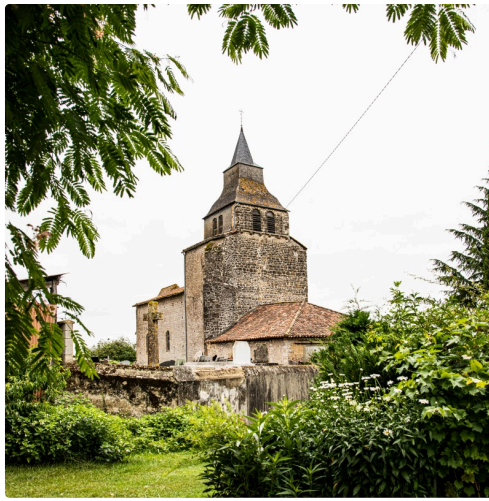
L'église Saint-Césaire de Pouydraguin