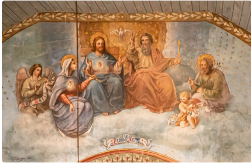
Arc roman de la Trinité