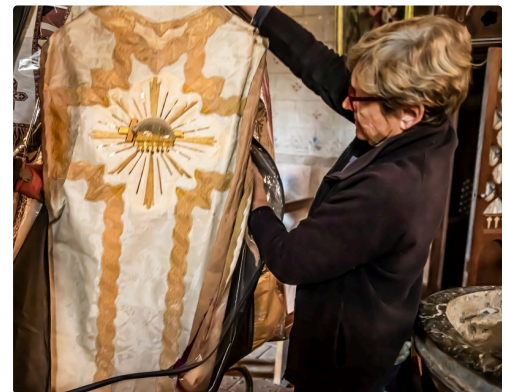
Encore un bel habit sacerdotal