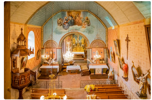
Le chœur vu de la tribune