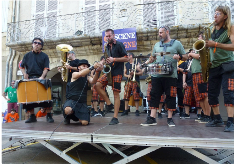
Les amateurs de "musique cuivrée" pourront profiter de deux jours de festival

Les Cuivro'Foliz en format réduit pour cette 23e édition