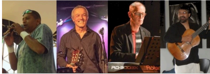
Pas de Tempo Latino mais un concert de musique latine à Rozès !

Avec la période estivale, l'association Confluence de Rozès relance ses activités par un concert de musique latine.