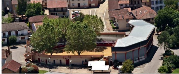
Boleros et pantalons blancs de retour dans les arènes de Nogaro !

Mercredi 14 juillet à 17 h 30, les arènes Robert Castagnon vont revivre au son de la Cazérienne.