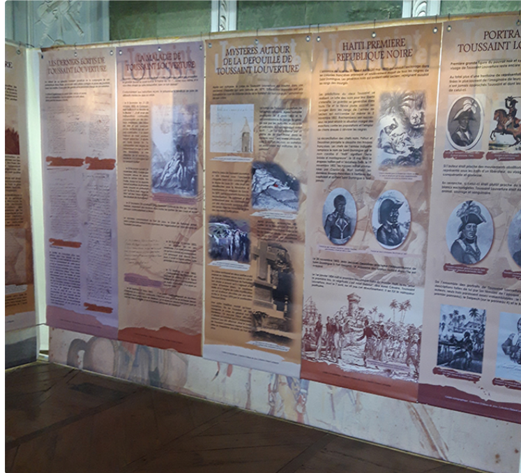
Les expositions du Château de L'Isle de Noé

L'association "Cham fils de L'Isle de Noé" présente toujours des nouveautés