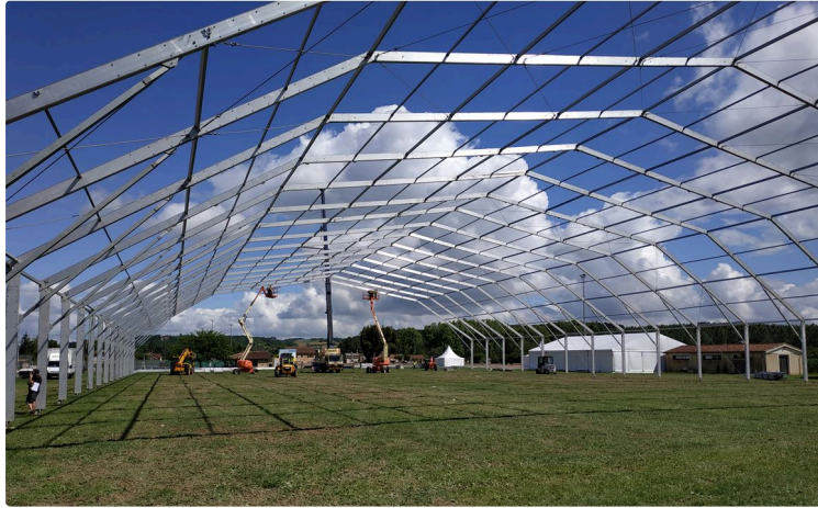
Le jour J approche le grand chapiteau en témoin