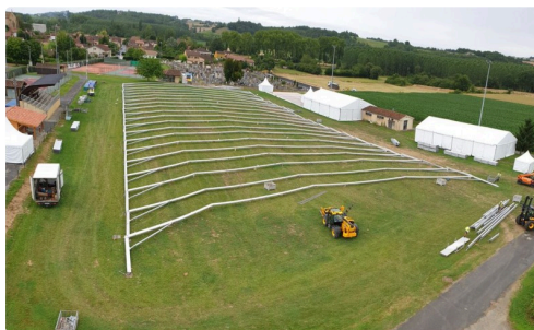
chapiteau 1ere etape.JPG