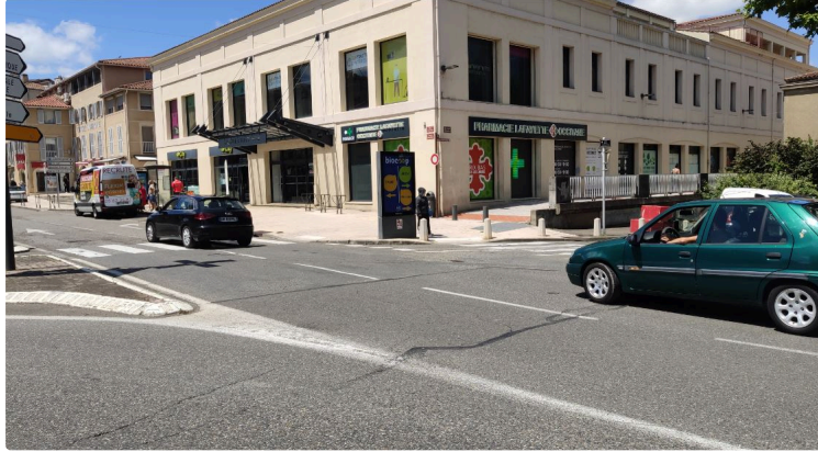
La vie de nos quartiers

Ne la cherchez plus avenue de l'Yser, la Parapharmacie Lafayette a retraversé une seconde fois le Gers pour revenir dans son quartier d'origine.