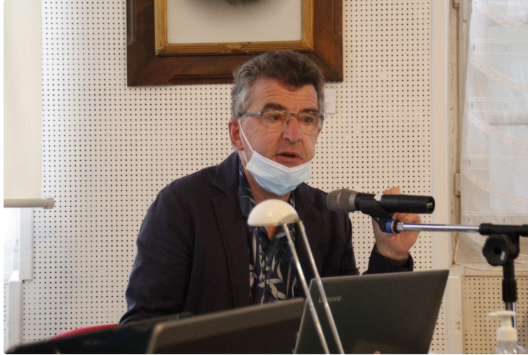
Le retour à la maison