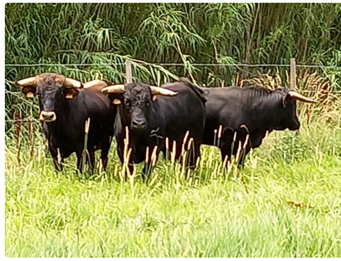
..et ceux de Malaga