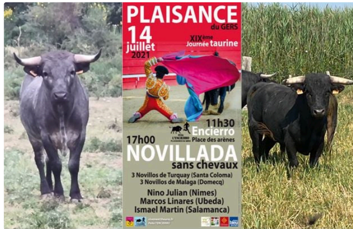
Les Novillos du 14 juillet sont choisis

Les Présidents de Vivement 5 Heures nous disent tout