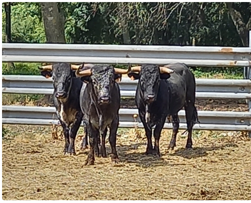
Les Novillos de Turquay