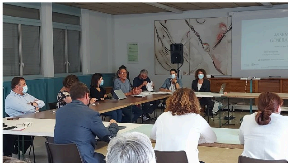
Assemblée Générale de l'Office de Tourisme d'Artagnan en Fezensac : une année 2020 difficile mais des projets ambitieux en 2021