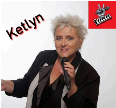
KETLYN the voice