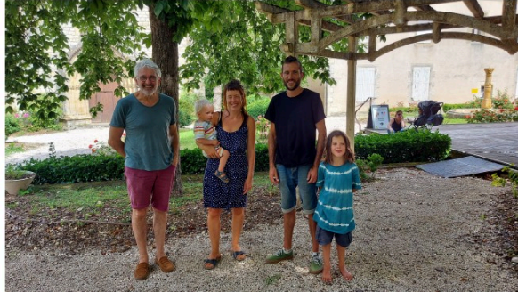
Les Petits Marchés des Soirs d'Été, ça commence mercredi 7 juillet !