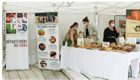
Stand Baland et Co.