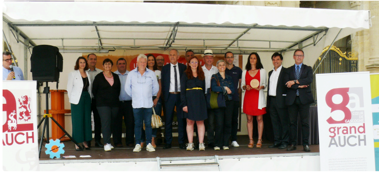
A la découverte des lauréats du concours départemental Biorigine Gers

Et aussi du concours national de la création agroalimentaire