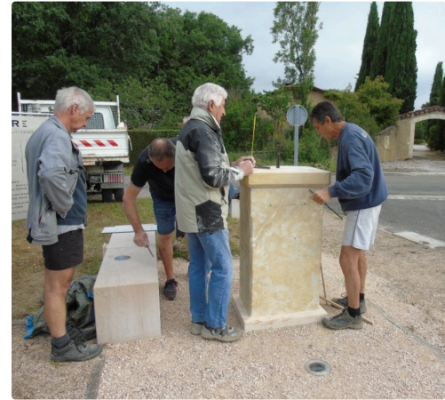
de fausse manoeuvre