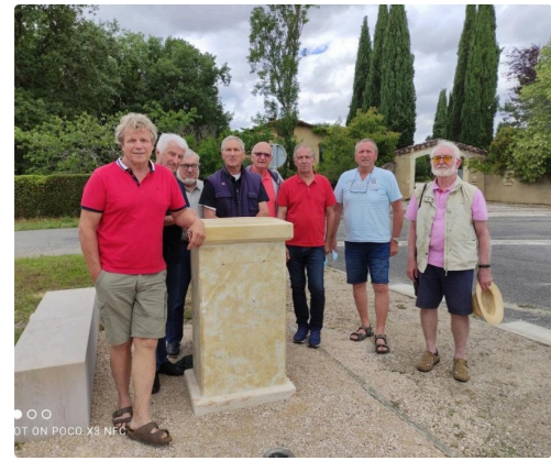
Les acteurs de la mise en place de la statue

Informations : Tél. : 06-35-95-16-10 ou 06-87-69-05-30 ou 07-81-93-18-14 https://www.italogascons.com/ Mail : italo.gascons@free.fr ou fogolar.fur.vuascogne@free.fr