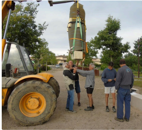
Un travail de précision