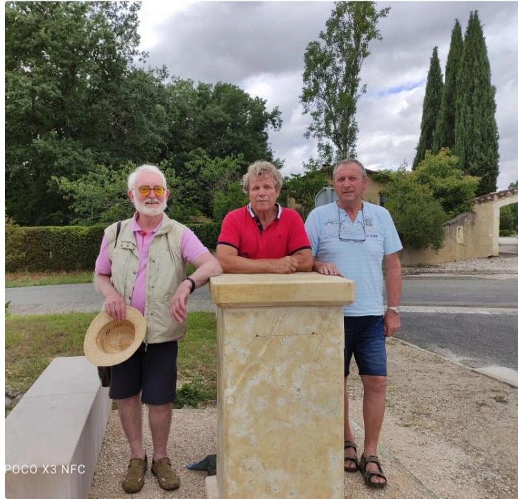
Centenaire de l'émigration italienne

La statue commémorative dévoilée le 17 juillet