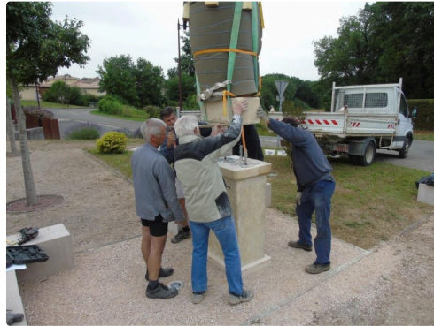
qui ne tolère pas