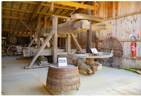
Antique presseoir à taissos