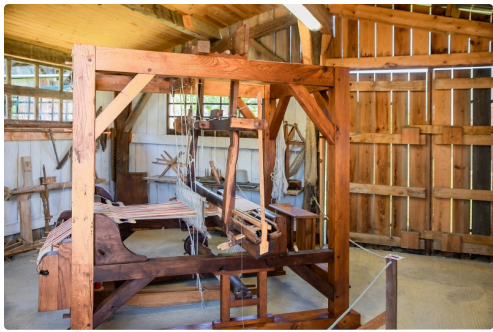
Métier à tisser du XVIIe siècle restauré et en état de marche