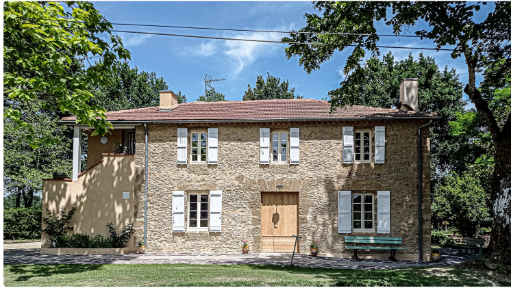
Le Musée du Paysan Gascon ouvre à nouveau le 6 juillet (Toujouse)

La maison Lacaze a été rénovée et abrite une expo d'apiculture