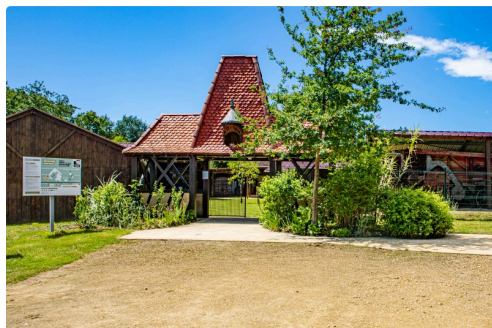
Entrée du Musée (en face de la maison Lacaze)

N.B. - Sur la photo du haut de page (communiquée par le Musée), la maison Lacaze après les travaux. Sur les photos ci-dessous, quelques uns des coins remarquables du Musée.