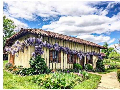
Maison de brassier (ouvrier agricole)