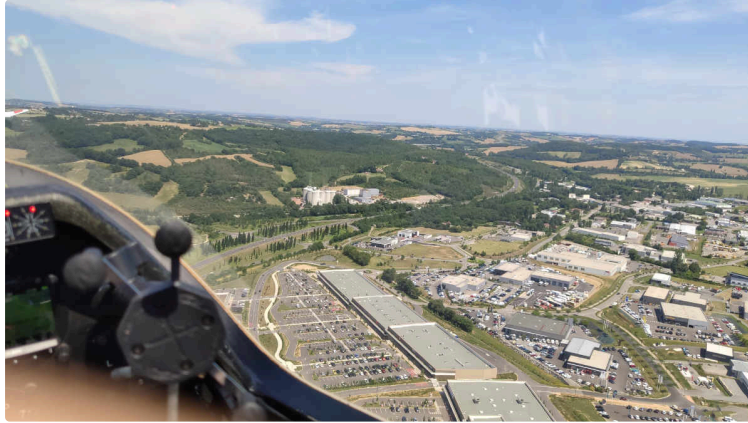
Vu d'en haut, c'est toujours plus beau !

Samedi dernier, initiation planeur : récit d'un vol à 800 mètres au-dessus d'Auch