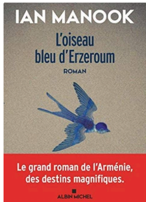
marciac oiseau bleu.JPG