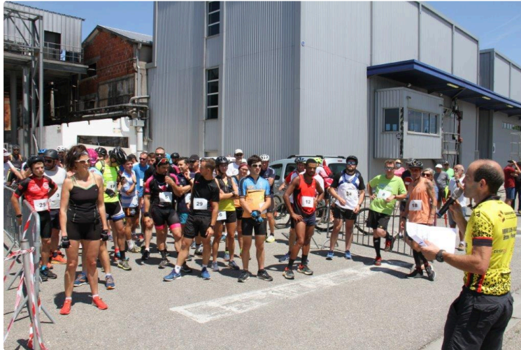
Un vélo pour deux

Dans le cadre de Vineart en Gascogne, la Cave Val de Gascogne, à Condom, proposait, samedi 26 juin, une animation culturelle dont le Journal du Gers vous a rendu compte dans un précédent article. Il s'agissait d'un spectacle de rue imaginé par Pitto Campa de La Boîte à Jouer, avec la collaboration d'un groupe musical toulousain, Sugar Bones, et d'une compagnie théâtrale, la Wouakatchie de la Mélodie des Hautes-Pyrénées.